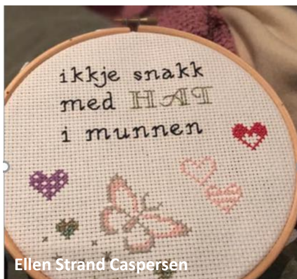
Ellen Strand Caspersen