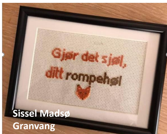
Sissel Madsø Granvang